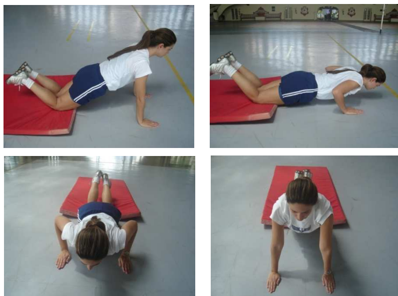
Figura 2 – Flexão e extensão dos membros superiores com apoio de frente sobre o solo para o sexo feminino