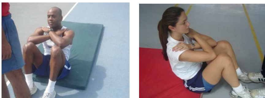
Figura 3 – Flexão de tronco sobre as coxas para os sexos masculino e feminino

Neste exercício serão exigidos os mesmos padrões de execução para ambos os sexos.