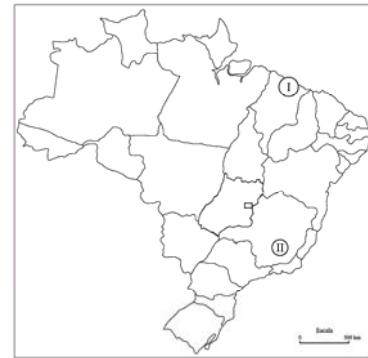
(Unesco, 2006. Adaptado.)