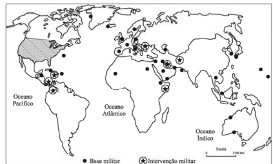
(Le Monde Diplomatique, 2006. Adaptado.)