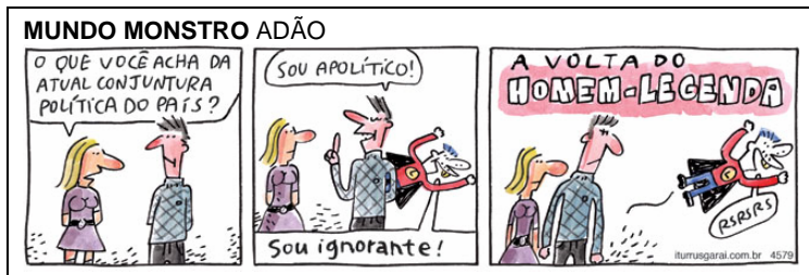
Folha de S. Paulo, 05/10/2011.

Os textos aqui reproduzidos falam de política, seja para enfatizar sua necessidade, seja para indicar suas limitações e impasses no mundo atual. Reflita sobre esses textos e redija uma dissertação em prosa, na qual você discuta as ideias neles apresentadas, argumentando de modo a deixar claro o seu ponto de vista sobre o tema Participação política: indispensável ou superada?